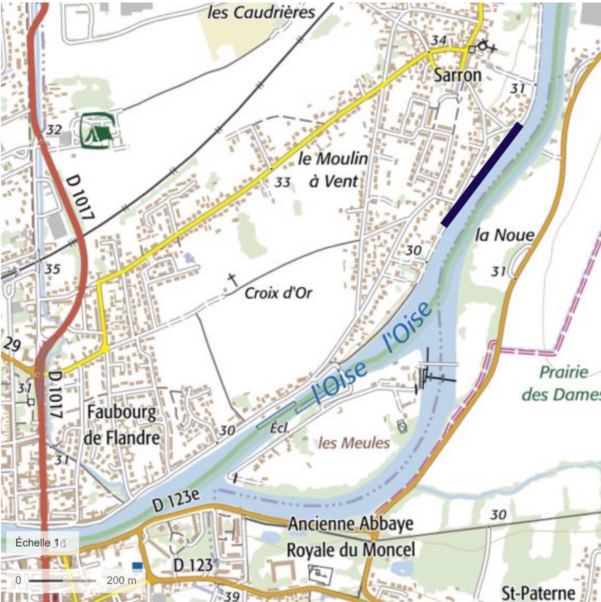
Annexe 1 : Carte de localisation de l'ouvrage.